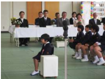
立派な態度でした！